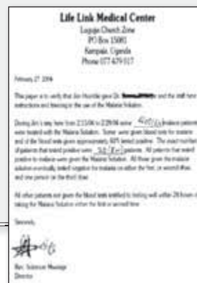
Kopie des Originalbriefes