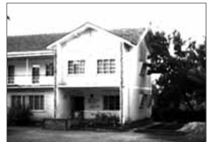
Oben: Das Life Link Medical Center in Kampala, Uganda.

In meinen Aufzeichnungen vermerkte ich damals Folgendes: „Nach 20 Minuten erbrach er. Nach einer Stunde war er nicht mehr in der Lage, Auto zu fahren. Er bekam Durchfall. Zu Hause angekommen, fühlte er sich völlig erschöpft. Er bewegte sich kaum, höchstens um zur Toilette