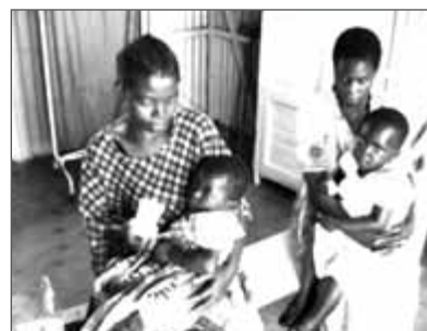
Zwei weibliche Häftlinge geben ihren Kindern das Mineralpräparat. Innerhalb von 24 Stunden waren die Kinder wieder wohllauf.

Die Gefängnisse in Malawi gleichen Konzentrationslagern. Das Gefängnis ist nur von einem mit Stacheldraht gekrönten Drahtzaun umgeben. In den Ecken stehen kleine Wachhütten für die bewaffneten Wachposten. Man fragte uns, ob wir auch den Frauentrakt sehen wollten, und natürlich wollten