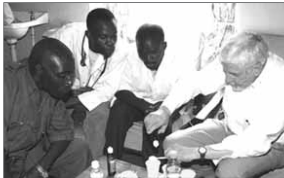
Drei der Gefängnis-Krankenpfleger lassen sich vom Autor erklären, wie man die Lösung dosiert.