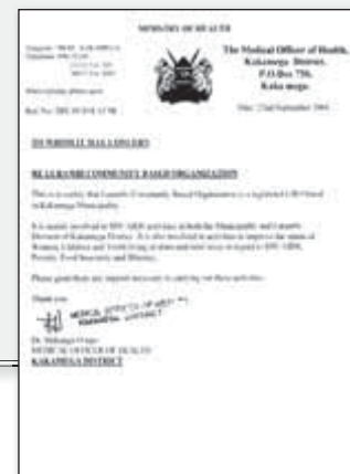
Kopie des Originalbriefes