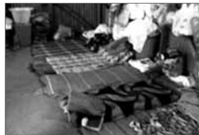
Fünf Matten im Frauenschlafsaal. Auch die Kinder der Inhaftierten schlafen hier.