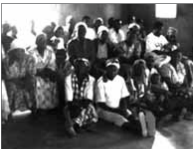
Das Foto zeigt eine Gruppe von Menschen, die in einer Kirche auf uns warten. Insgesamt kamen über 300 Personen.