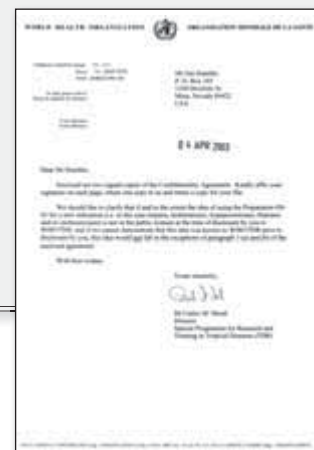
Kopie des Originalbriefes