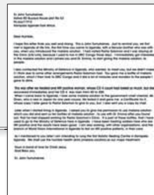
Kopie des Originalbriefes