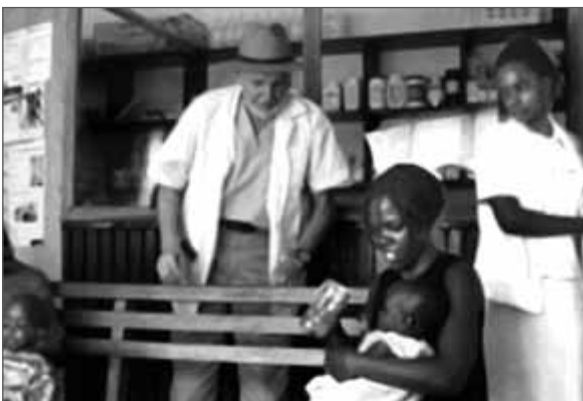
Der Autor und eine Krankenschwester beobachten, wie eine Mutter ihrem Kind im Life Link Medical Center in Kampala, Uganda, das Mineralpräparat gibt.

Ich nutzte für die Behandlung die Erfahrungswerte, die ich in der Mission im kenianischen Kakamega gesammelt hatte, begann also mit 30 Tropfen. Beinahe jedem der Patienten hier ging es hinterher schlechter, und viele erbrachen. Zwar ging es allen nach einigen Stunden oder spätestens am nächsten Tag besser, aber das Erbrechen war nicht normal. Der Malariaerreger hier musste wieder ein anderer sein. Alle hiesigen Malaria-patienten wiesen eine vergrößerte Milz auf. Höchstwahrscheinlich hatte es etwas mit der vergrößerten Milz zu tun, dass die Tropfen auf diesen Erregerstamm anders reagierten, denn bei den Malariapatienten in Kakamega war die Milz nicht vergrößert gewesen. Nicht jedem wurde schlecht, und daher machten wir mit der Behandlung weiter. Aber mit der Zeit blieben die Patienten weg.