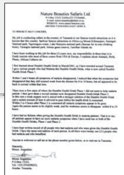
Kopie des Originalbriefes