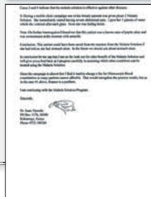
Kopie des Originalbriefes