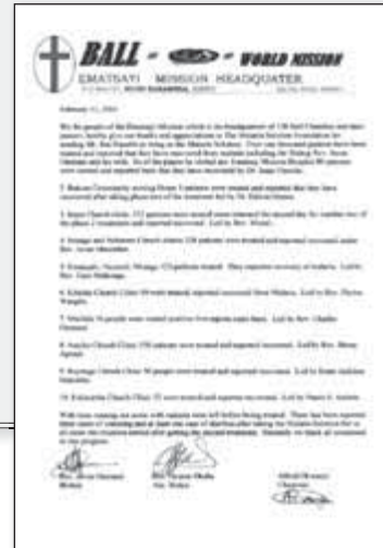
Kopie des Originalbriefes