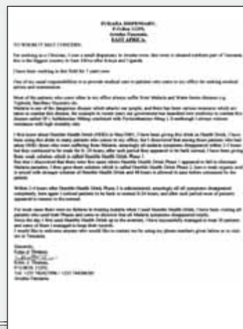
Kopie des Originalbriefes