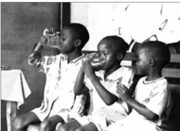
Den meisten Kindern schien das Mineralpräparat wohl ein Wundertrank zu sein. Diesen dreien hier ging es jedenfalls so.