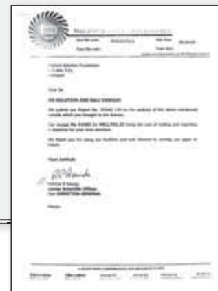
Kopie des Originalbriefes