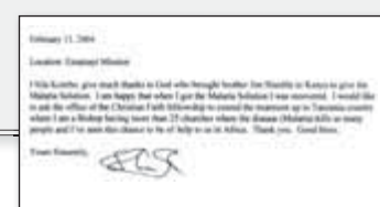
Kopie des Originalbriefes