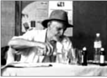
Der Autor bereitet im Behandlungsraum die einzelnen Dosen vor.

zu gehen. Die Reaktion setzte gegen 11 Uhr morgens ein, und als wir ihn um 16 Uhr nach Hause brachten, ging es ihm wieder besser. Um 20 Uhr erhob er sich von der Couch, auf der er gelegen hatte. Ihm sei kein bisschen übel mehr, sagte er, nur schwach fühle er sich noch. Am folgenden Morgen war ihm etwas schwindelig, sonst aber fühlte er sich gut.“ Von Anfang bis Ende seiner Tortur war er guter Dinge. Selbst als ihm schlecht wurde, blieb seine Begeisterung ungetrübt, weil er darin die Wirkung des Präparats sah. Am nächsten Tag, als alles überstanden war, sagte er, er könne kaum glauben, wie gut er sich fühle.