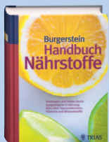
Uli P. Burgerstein Stiftungsratspräsident

Für alle, die nun neugierig geworden sind – das Buch ist im Buchhandel erhältlich oder kann unter www.burgerstein.ch bestellt werden.