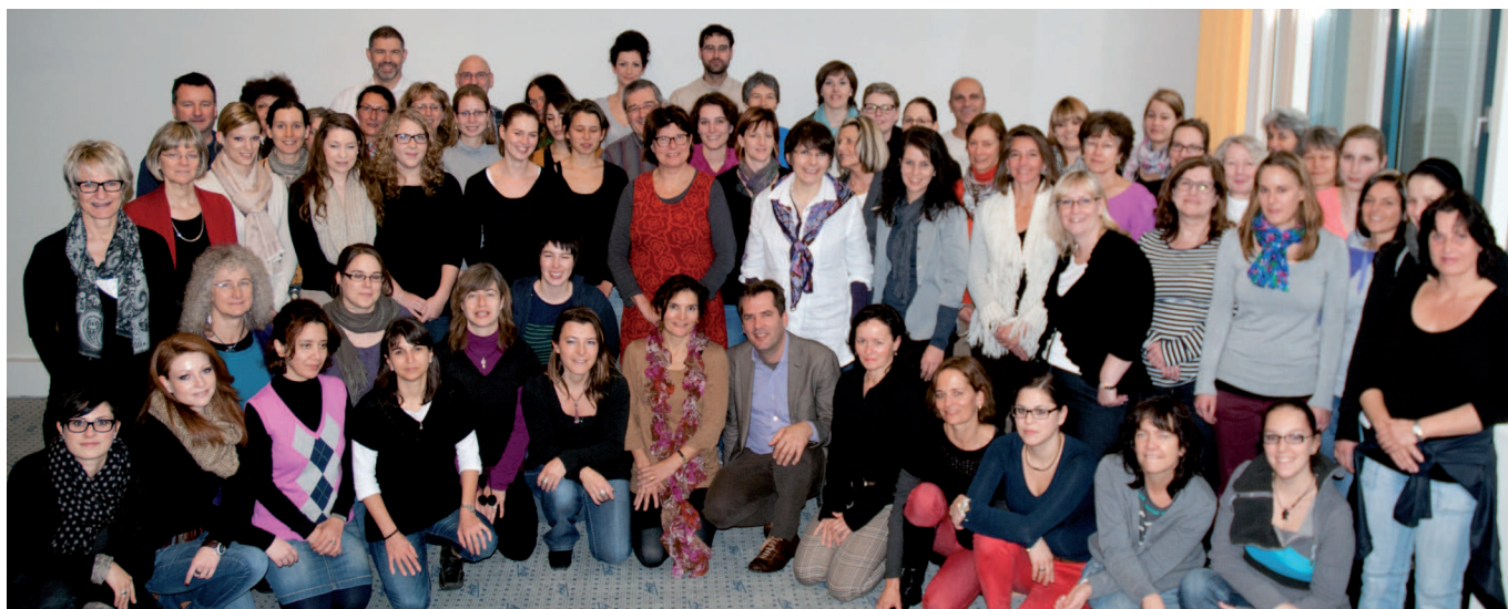
Erste erfolgreiche Absolventen «FachberaterIn Orthomolekulare Medizin», November 2012.

Im Jahr 2012 wurde nach erfolgreichem Abschluss des OM-Zyklus zum ersten Mal der Titel «Fachberater Orthomolekulare Medizin» vergeben. Das Diplom, welches nach bestandener Prüfung im Namen der OM Foundation übergeben wird, zeichnet die Teilnehmer als Spezialisten auf diesem Gebiet aus. Als weiteres Novum wurde dieser Lehrgang (5-tägig) im Frühling 2013 auch in der Westschweiz angeboten.