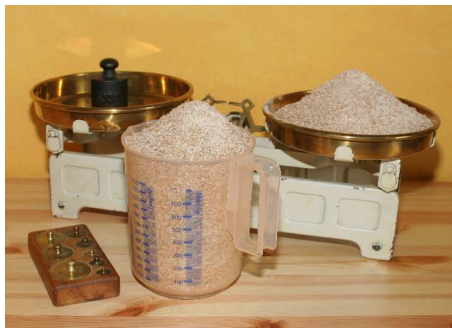
Abbildung 1 1 Kilogramm Mehl im Messbecher und 0,5 Kilogramm auf der Waage; das ist die Menge an Zusatzstoffen, die jeder Bürger im Jahr zu sich nimmt

Unsere heutigen Nahrungsmittel sind zu 80 Prozent industriell verarbeitet. Der Arzt Dr. Markus Pfisterer sagt, dass im Durchschnitt jeder Bürger pro Jahr 1,5 Kilogramm an Zusatzstoffen zu sich nimmt. 1,5 Kilogramm! Das sind über 4 Gramm am Tag an Zusatzstoffen, die man eigentlich nicht bräuchte. Dazu zählen Aromen, Farbstoffe, Mundföhlregulatoren, Geschmacksverstärker, Konservierungsstoffe oder Stabilisatoren.