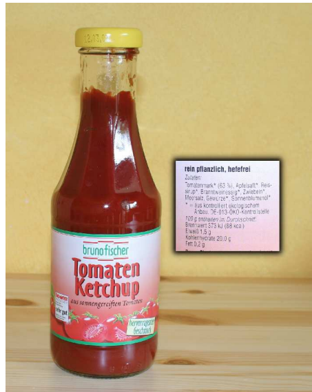
Abbildung 3 Ketchup ohne Zucker

Die gewohnte Rübenzucker-raffinade, also der bei uns übliche Zucker, kann sehr gut durch Rohrohrzucker, oder noch besser: Vollrohrzucker ersetzt werden. Hierbei handelt es sich um den getrockneten, natürlichen Saft des Zuckerrohrs. Er besitzt einen angenehm milden, leicht karamell-artigen Geschmack, der etwas an Honig erinnert, und weist einen hohen Mineralgehalt von insgesamt über 1,5 Prozent auf. Er hat eine dunkle Farbe und eignet sich vorzüglich zum Backen.