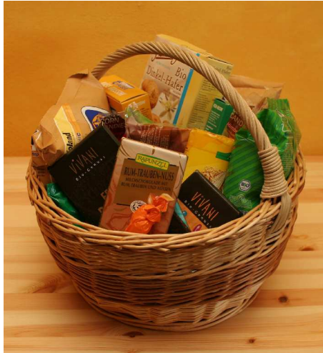
Abbildung 4 Verzichten muss man wirklich auf nichts.

also nicht. Das ist auch gut so. Stellen Sie sich einerseits eine Erdbeere vor, andererseits einen Zuckerwürfel mit Erdbeeraroma und rotem Farbstoff beträufelt. Das eine ist zweifellos gesund, das andere so ziemlich das Gegenteil davon. Alle Süßigkeiten, die man käuflich erwerben kann, liegen irgendwo dazwischen. Die Kunst ist nun eben, diejenigen auszuwählen, die sich nicht allzu negativ auswirken. Das ist eigentlich nicht so schwer. Dummerweise gilt in