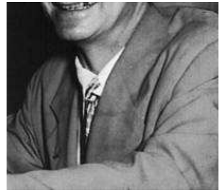
Professor Linus Pauling

Die ersten Symptome des Skorbut sind nachlassende Körperkraft, Ruhelosigkeit, Depressionen und Erschöpfung. Die Haut wird fahl und dunkelgrau, der Kranke klagt über Muskelschmerzen. Es entstehen Mundgeschwüre, die Zähne fallen aus, der Atem riecht faul. In Muskeln und anderen Geweben entstehen große blutunterlaufene Stellen (durch innere Blutungen), die wie schwere Prellungen aussehen. Die letzten Stadien der Krankheit kennzeichnen Durchfall, totale Erschöpfung und schwerste Schädigungen von Lungen, Nieren und Herz mit Todesfolge.